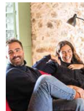
Waiata Kalma e Nikolaos Resin